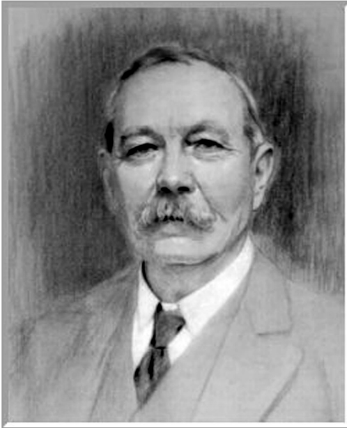
Sir Mrthur YonaΨoyla 1859-1930

παραμένουσα πλησίον αὐτοῦ, συνώδευσε ταύτην εἰς τὴν οἰκίαν της. Ἀλλὰ μετὰ τινὰ λεπτὰ τῆς ὥρας ἀπὸ τῆς ἐκεῖ ἀφίξεώς των καὶ ἐνῶ ἐκάθηντο ἐν δωματίῳ εἰς τὸ ὁποῖον εὐρίσκετο κιθάρα ἀνηρτημένη ἐπὶ τοῦ τοίχου, αἴφνης ἄνευ οὐδεμιᾶς ὁρατῆς ἐνεργείας ἠκούσθη ἰσχυρὸς ἦχος παραχθεις ἐκ συγχρόνου πλήξεως ὄλων τῶν χορδῶν τῆς κιθάρας, αἱ ὁποῖαι καὶ ἔσπασαν, γεγονός ὅπερ κατετάραξε μεγάλως αὐτούς. Παρατήρησαν οὗτοι τὸ ὠρολόγιόν των ἐξηκριβώθη δὲ βραδύτερον ὅτι ἡ ὥρα τοῦ ἤχου συνέπιπτε πρὸς τὴν ὥραν τοῦ θανάτου. Σημειωτέον δὲ ὅτι ὁ ἀποβιώσας ὢν μουσικόφιλος συχνὰ μετεχειρίζετο τὴν κιθάραν...».